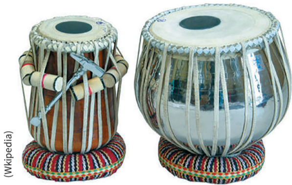
Tabla to nazwa bardzo starego instrumentu, który tworzą dwa nieduże bębny – dajan i bajan. Dajan i bajan są podobne do siebie niczym bracia – różnią się jednak wielkością i głosem. Ponadto korpus dajana jest zrobiony z drewna, a bajana z metalu. Na korpusy bębnow naciągnięte są skórzane membrany. Grający lekko uderza w nie nasadą dłoni lub palcami. Mieszkańcy Indii tańczyli i śpiewali przy dźwiękach tabli już wiele wieków temu, a i obecnie używają tego instrumentu przy wykonywaniu muzyki tradycyjnej.