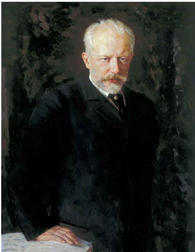
Nikolai Dmitriyevich Kuznetsov (1850–1929) Portret Piotra Czajkowskiego, olej na płótnie, 1893 Portrait of Pyotr Tchaikovsky, oil on canvas, 1893