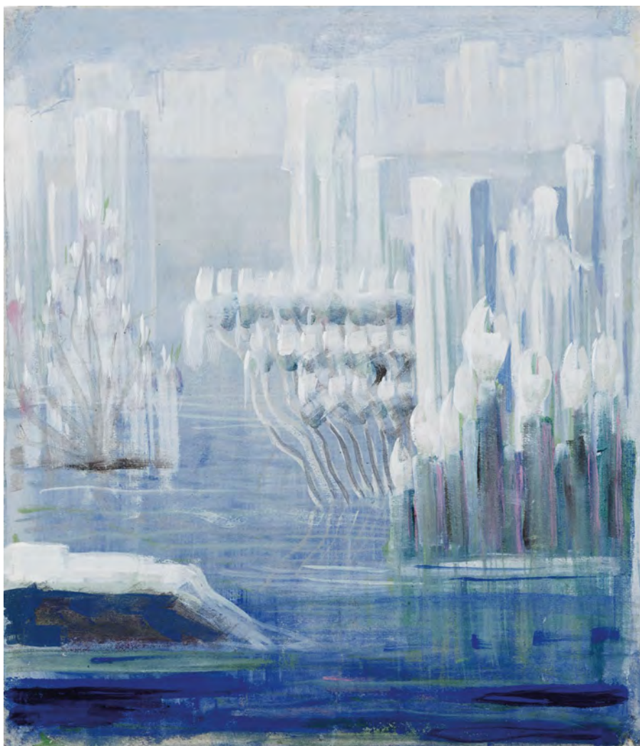
Mikalojus Konstantinas Čiurlionis (1875–1911) Stworzenie świata VI , tempera na papierze, 1905 / Creation of the World VI , tempera on paper, 1905