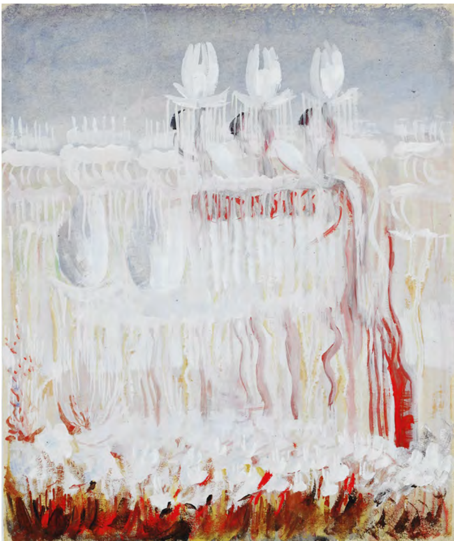
Mikalojus Konstantinas Čiurlionis Stworzenie świata VIII , tempera na papierze, 1905 / Creation of the World VIII , tempera on paper, 1905