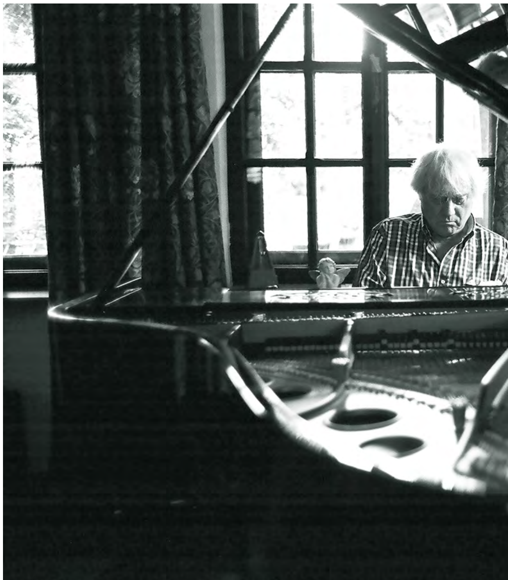
Jerzy Maksymiuk, 2013