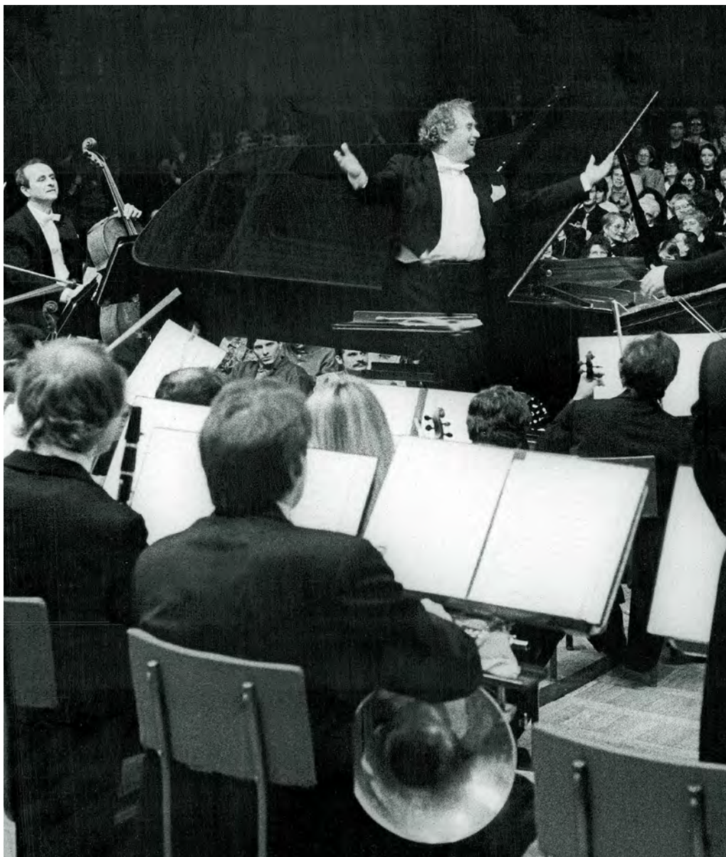
Jerzy Maksymiuk i Piotr Paleczny z Sinfonią Varsovią, Sala Koncertowa Filharmonii Narodowej, Warszawa, 1992 / Jerzy Maksymiuk and Piotr Paleczny with Sinfonia Varsovia, Warsaw Philharmonic Concert Hall, 1992