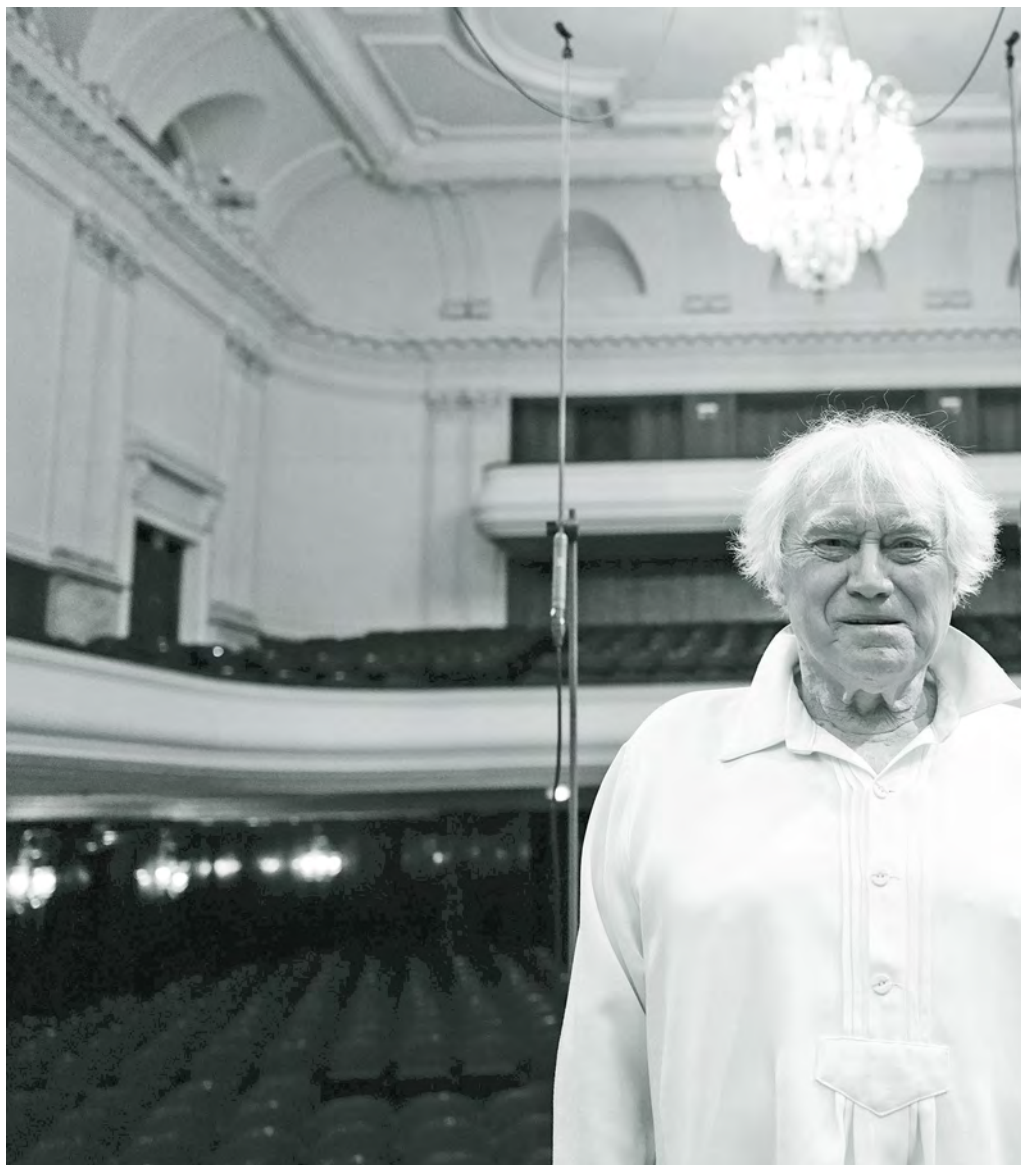
Jerzy Maksymiuk w Sali Koncertowej Filharmonii Narodowej, Warszawa, 2021 / Jerzy Maksymiuk at the Warsaw Philharmonic Concert Hall, 2021