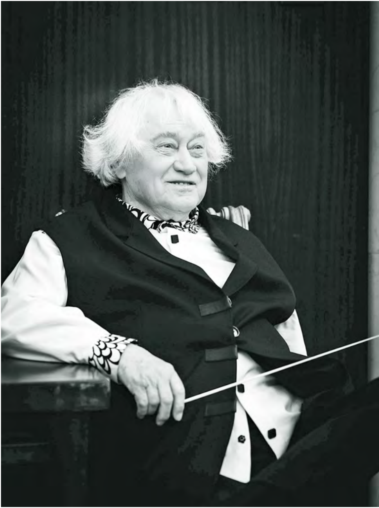
Jerzy Maksymiuk w Filharmonii Narodowej, Warszawa, 2024 / Jerzy Maksymiuk at the Warsaw Philharmonic, 2024