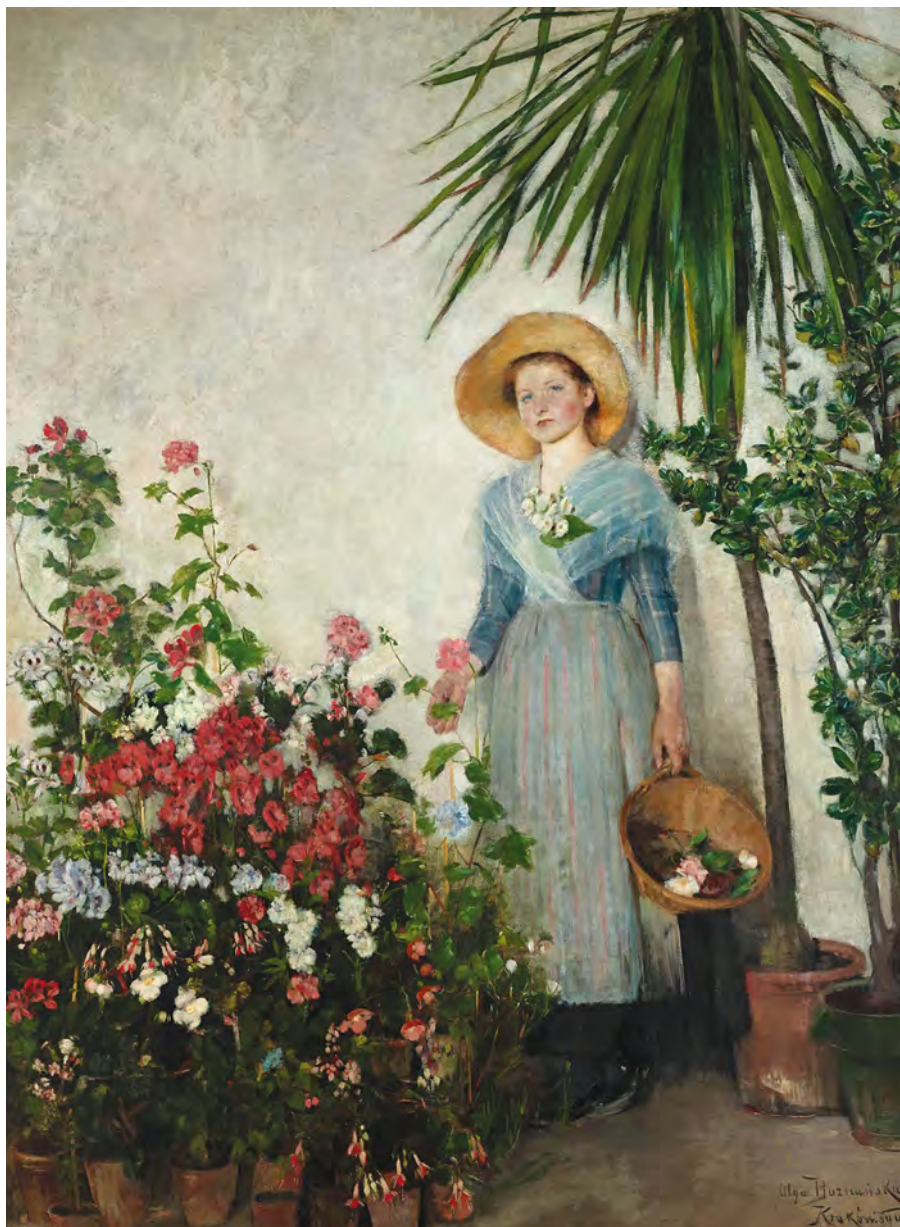
Olga Boznańska (1865–1940) W oranżerii , olej na płótnie, 1890 / In the Orangery , oil on canvas, 1890