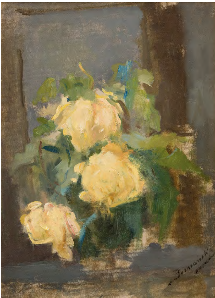
Olga Boznańska Złote róże , olej na płótnie, 1896 / Golden Roses , oil on canvas, 1896